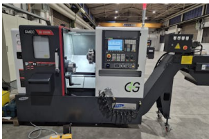
CNC Dreh-Fräszentrum SMEC, NS 2000 M Baujahr: 2022, Steuerung: Siemens SINUMERIK 828D, Drehdurchm. [mm]: 288, Drehlänge [mm]: 243