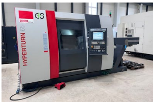
CNC Drehmaschine EMCO, Hyperturn 65 Baujahr: 2017, Steuerung: Siemens 840Dsl, Drehdurchm. [mm]: 500, Drehlänge [mm]: 800