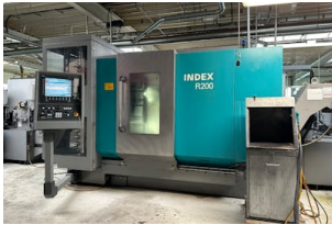
CNC Dreh-Fräszentrum Index, R 200 Baujahr: 2011, Steuerung: Siemens C200-4D SL