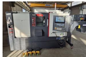
CNC Drehmaschine SMEC, SL 2000 M Baujahr: 2023, Steuerung: Siemens 828D - ShopTurn, Drehdurchm. [mm]: 360, Drehlänge [mm]: 520