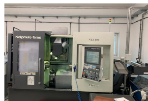
CNC Dreh-Fräszentrum Nakamura, NTJ-100 Baujahr: 2015, Steuerung: Fancu 31i-B, Drehdurchm. [mm]: 175, Drehlänge [mm]: 678