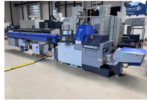
CNC Drehmaschine Star, SB-20R type G Baujahr: 2022, Steuerung: Fancu Oi-TF