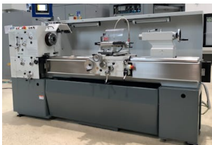
Drehmaschine - konventionell WEILER, DA 260 x 1500 Baujahr: 2024, Steuerung: Heidenhain ND 7013, Drehdurchm. [mm]: 345, Drehlänge [mm]: 1500