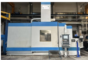
Vertikaldrehmaschine Dörries, Contumat VCE 2000-160 Baujahr: 1991, Steuerung: Siemens 840 Dsl, Drehdurchm. [mm]: 1600, Drehlänge [mm]: 1800