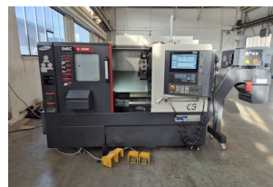
CNC Drehmaschine SMEC, SL 2000 M Baujahr: 2023, Steuerung: Siemens 828D - ShopTurn, Drehdurchm. [mm]: 360, Drehlänge [mm]: 520