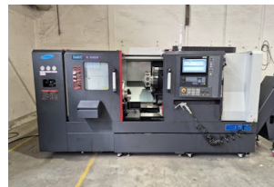
CNC Drehmaschine SMEC, SL 3000 BLM Baujahr: 2023, Steuerung: Siemens 828D - ShopTurn, Drehdurchm. [mm]: 405, Drehlänge [mm]: 956