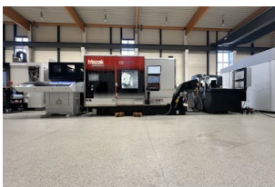
CNC Dreh-Fräszentrum Mazak, Integrex i-100H S Baujahr: 2023, Steuerung: Mazak Mazatrol SmoothAi, Drehdurchm. [mm]: 600, Drehlänge [mm]: 850