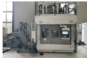
Vertikaldrehmaschine EMAG, VTC 250 DUO DD Baujahr: 2020, Steuerung: Siemens 840 Dsl, Drehdurchm. [mm]: 140, Drehlänge [mm]: 700